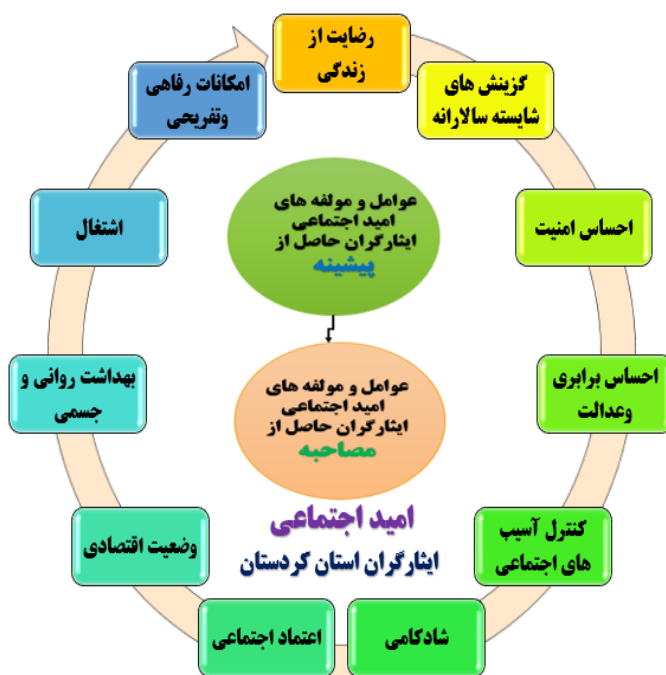
شکل (۲) مؤلفه‌های استخراج‌شده پژوهش

شکل (۲) مدل مفهومی پژوهش، با تم‌های اصلی حاصل از اعمال نظر خبرگان از طریق مصاحبه با درون‌مایه‌های اصلی: مطالعه امید اجتماعی جانبازان و ایثارگران استان کردستان