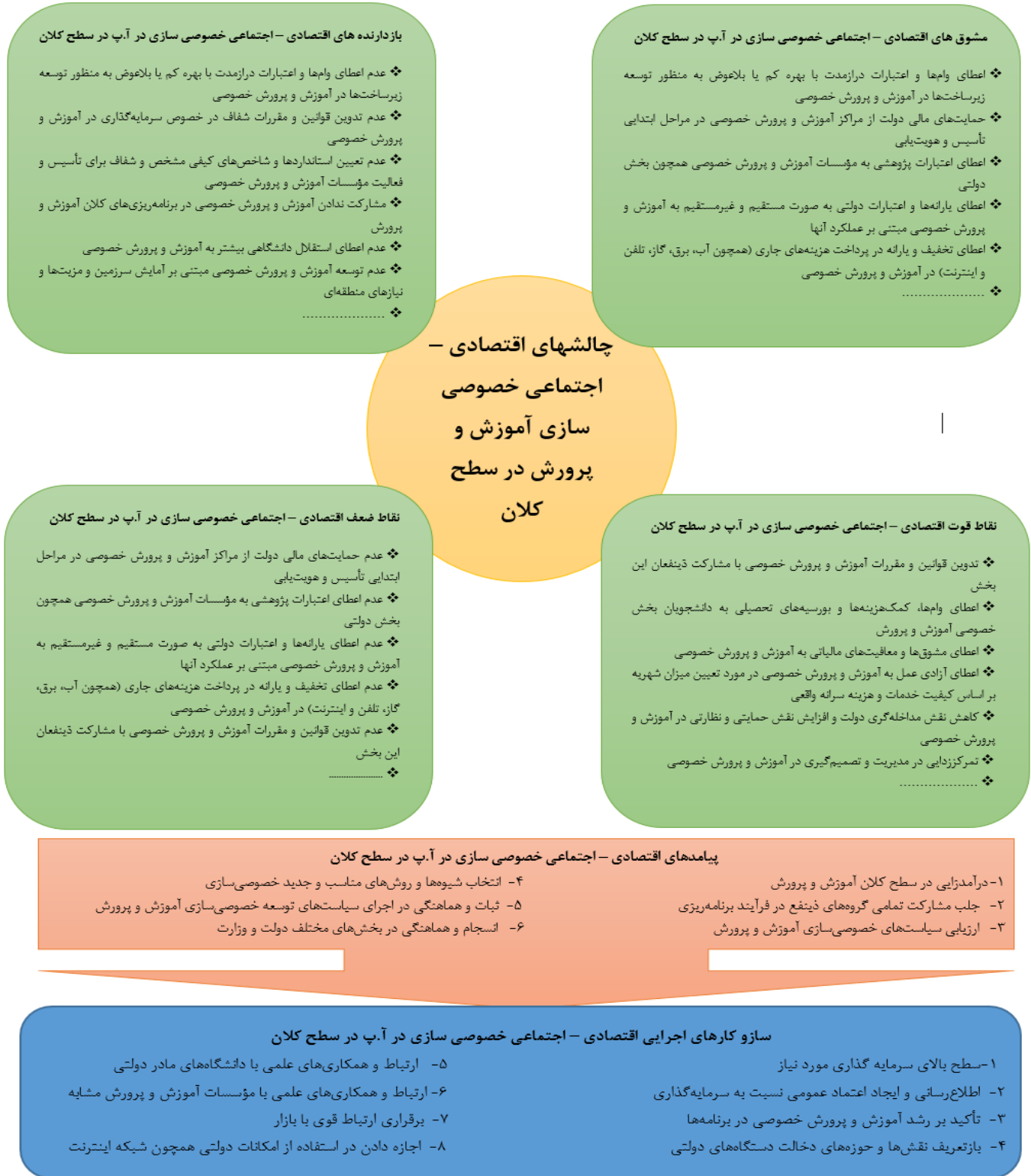
شکل ۱. مدل مفهومی چالش های کلان اقتصادی - اجتماعی خصوصی سازی آب