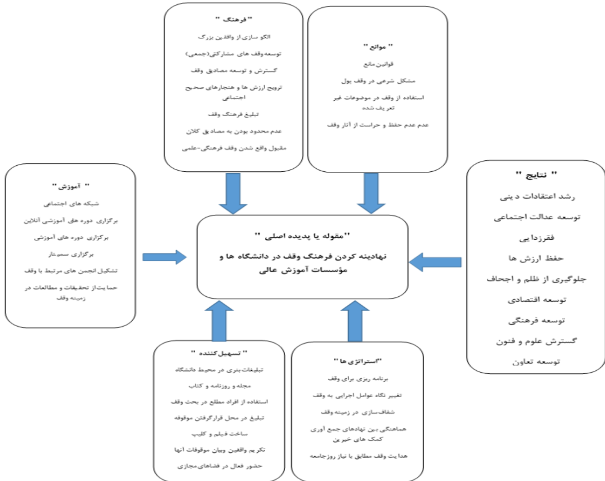
شکل ۱. مدل پارادایمی نهادینه کردن فرهنگ وقف در دانشگاه‌ها و مؤسسات آموزش عالی

۱/۹۶ بیشتر می‌باشد، بنابراین می‌توان نتیجه گرفت که در سطح معناری ۹۵ درصد، کلیه سوالات برای مدل معادلات ساختاری مد نظر قرار می‌گیرد.