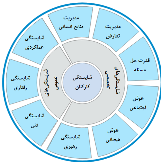
شکل (۱) مدل مفهومی پژوهش

حرفه‌ای و تخصصی (بلاسکوا و همکاران؛ محمدفام و همکاران؛ رعنائی و همکاران)، شایستگی‌های رهبری و مدیریتی (چیت‌ساز و همکاران؛ محمودی و همکاران؛ کرمی و همکاران؛ رعنائی و همکاران؛ شیان و همکاران)، شایستگی‌های اخلاقی (ساجگالیکاوا و همکاران؛ چیت‌ساز و همکاران)، شایستگی‌های ارتباطی، اجتماعی، میان‌فردی (ساجگالیکاوا و همکاران؛ چیت‌ساز و همکاران؛ محمودی و همکاران؛ کرمی و همکاران؛ محمدفام و همکاران؛ رعنائی و همکاران؛ لیکاما)، شایستگی‌های فرهنگی (زارعی متین و همکاران؛ جودیت و همکاران)، شایستگی‌های فردی و شخصیتی (محمودی و همکاران؛ کرمی و همکاران؛ رعنائی و همکاران؛ لیکاما)، شایستگی‌های ادراکی (زارعی متین و همکاران؛ کرمی و همکاران؛ محمدفام و همکاران؛ رعنائی و همکاران؛ کوهن)، و شایستگی‌های اقتصادی (چیت‌ساز و همکاران؛ محمودی و همکاران) اشاره نمود. بنابراین با توجه به مبانی مطرح شده و مطابق نظر اساتید محترم، متغیرهای تحقیق در قالب مدل مفهومی زیر ارائه شده است.