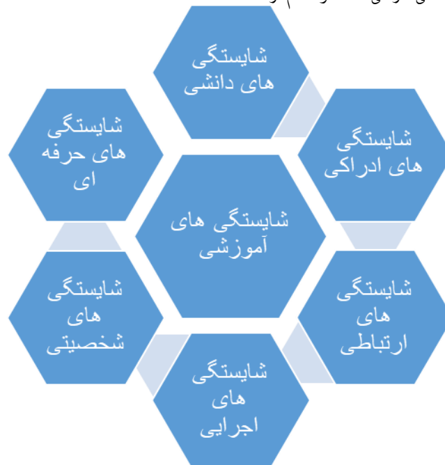
شکل ۱. چارچوب نظری پژوهش

چارچوب نظری پژوهش حاضر الگوی شایستگی مدیران آموزشی خنیفر و همکاران (۶) تشکیل می‌دهد، در این الگو شش نوع شایستگی بدست آمد که عبارتند از: شایستگی دانشی، شایستگی حرفه‌ای، شایستگی شخصیتی، شایستگی اجرایی، شایستگی رهبری و هدایت، شایستگی ارتباطی و شایستگی ادراکی. که هر کدام از