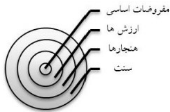
شکل ۱. عناصر اصلی فرهنگ سازمانی

هستند. این‌ها شامل رفتارهای مشهود و همین‌طور ساختارها، رویه‌ها، قوانین و ابعاد فیزیکی سازمان هست.