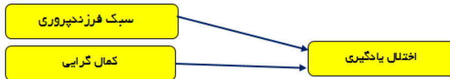
شکل ۱- مدل مفهومی پژوهش

فرزندپروری و کمال‌گرایی والدین و مثبت‌گرای دانش‌آموزان دبستان رابطه وجود داشت (۳۱). Kakavand و همکاران در مطالعه ای توصیفی از نوع همبستگی، تحت عنوان شناسایی رابطه سبک‌های والدین و کمال‌گرایی والدین با دانش‌آموزان عادی و کمال‌طلبی دانش‌آموزان تیزهوشان که به روش تصادفی ساده و با استفاده از پرسشنامه صورت گرفت نتایج نشان داد که کمال‌گرایی سازگار و ناسازگار دانش‌آموزان بر اساس کمال‌گرایی و سبک‌های فرزندپروری والدین قابل پیش‌بینی نیستند (۳۲).