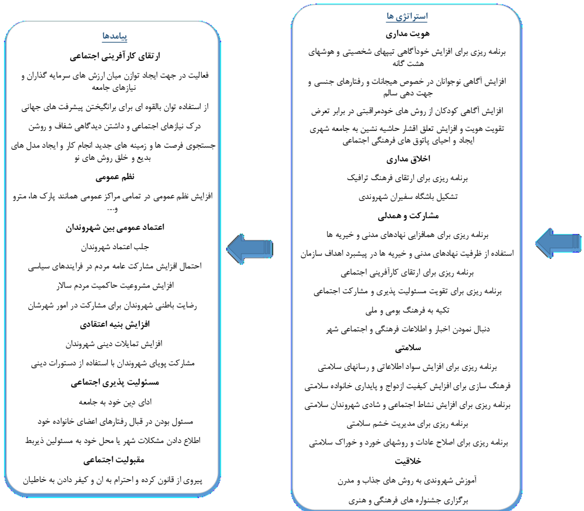
شکل ۲: الگوی شهروند فرهنگی

این دسته‌بندی و توافقی که در ادامه هر کدام از این دسته‌بندی‌ها به صورت مجزا آورده شده است.