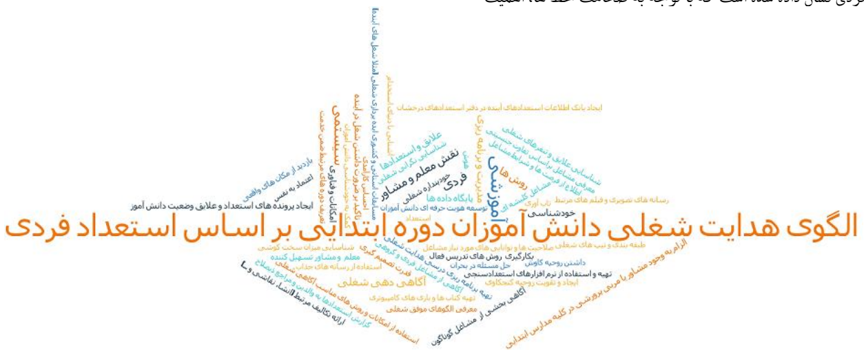
شکل ۳: نمای ابری مولفه ها، زیر مولفه ها ابعاد هدایت شغلی دانش آموزان دوره ابتدایی براساس استعدادهای فردی

با اشاره به شکل ۱ و شکل ۲ که خروجی نهایی نرم افزار است، ابعاد هدایت شغلی دانش آموزان دوره ابتدایی براساس استعدادهای فردی نشان داده شده است که با توجه به ضخامت خط ها، اهمیت