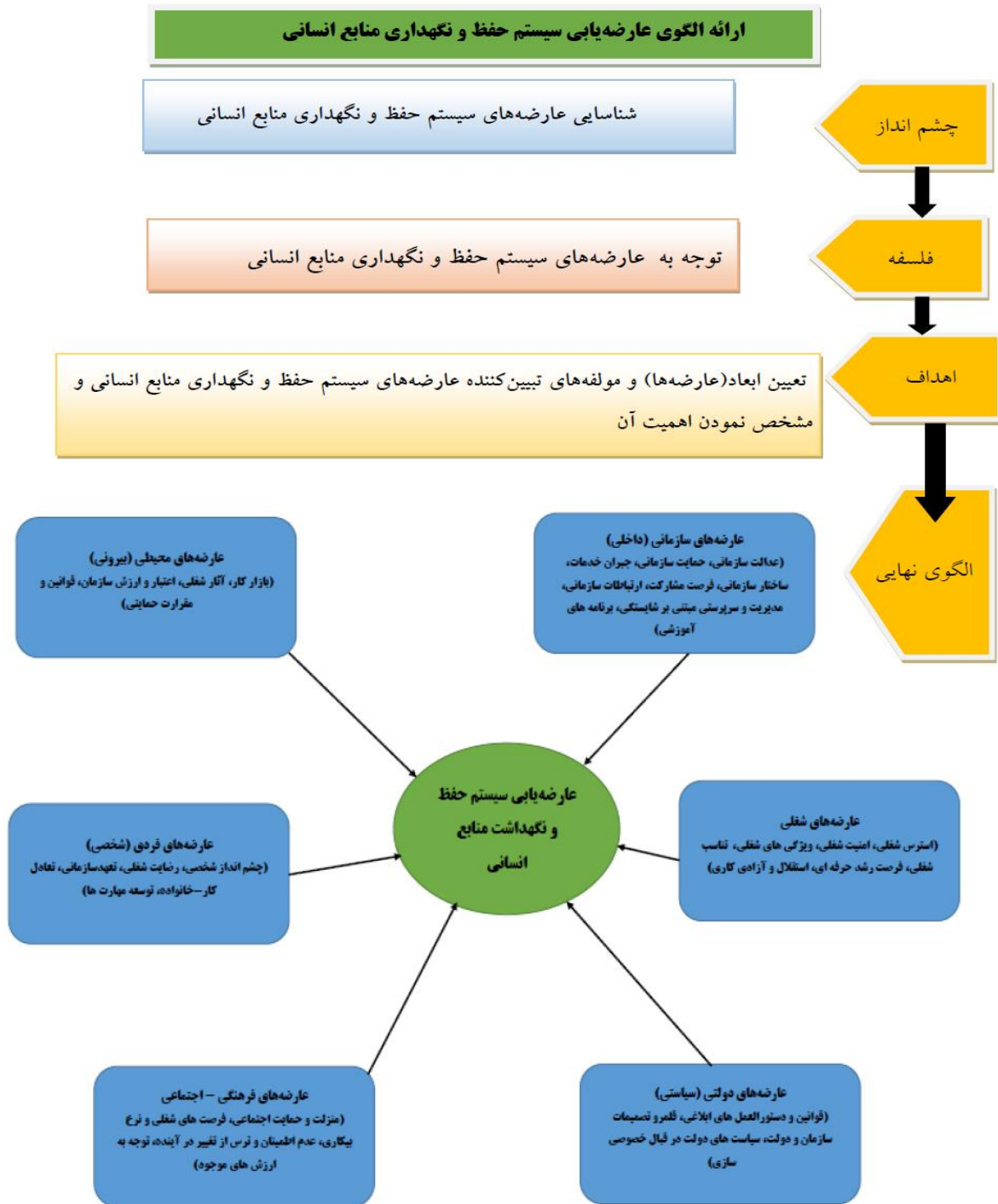
شکل ۳: الگوی عارضه‌های سیستم حفظ، نگهداشت و آموزش منابع انسانی

اجتماعی(۰/۹۳ و ۷/۱۶۸)، تبیین‌کننده الگوی نهایی پژوهش بوده‌اند. نتایج بخش اولویت‌بندی هم، حاکی از اهمیت بیشتر عارضه‌های شغلی و مولفه «استقلال و آزادی کاری» داشته است. باتوجه به ابعاد شناسایی‌شده در مدل، نتایج تحقیق حاضر تائیدکننده نتایج حاصل از