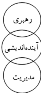
شکل ۱. ارتباط آینده‌اندیشی، رهبری و مدیریت (کرامت زاده، ۱۳۹۵)

مدیریت دولتی نوین ۱ ناشی از تحولات سریع در عرصه جهانی و ضرورت بازبینی در مدیریت و اداره امور بوده و تلاشی است برای بهره‌گیری از دانش و تجربه بخش خصوصی تا کارایی، اثربخشی و بهره‌وری خدمات عمومی در سازمان‌های دولتی را ارتقا بخشد (۱). در مدیریت گرایی، مدیران و مجریان وارد مسائل سیاست‌گذاری می‌شوند و به طریقی در خط‌مشی‌گذاری دخالت می‌کنند. مدیرانی که اگر اشتباهی رخ دهد، خودشان با قبول مسئولیت، بهای آن را می‌پردازند (۲). توجه به برون داده‌ها، دگرگونی در درون سیستم اداری، کاستن از دامنه دولت و سرانجام ارتباط با سیاستمداران و مردم از ویژگی‌های مورد تأکید در این رویکرد است. (۳) آینده‌اندیشی، حلقه مفقوده مدیریت و رهبری است. نقش‌های سه‌گانه مدیریت، آینده‌اندیشی و رهبری در تمامی حوزه‌های سیاسی، اجتماعی، اقتصادی، فرهنگی و کسب‌وکار قابل تعمیم است (۴).