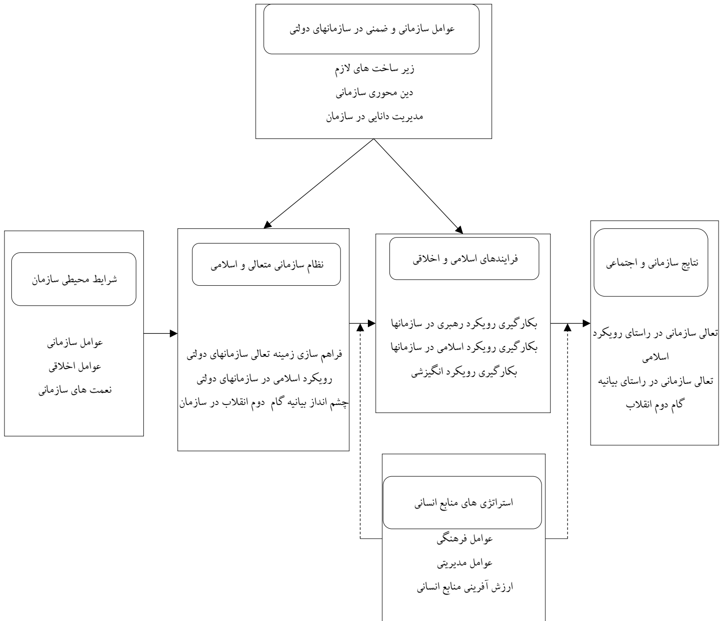
شکل ۱- مدل مفهومی تحقیق

از روش نظرسنجی از خبرگان استفاده شده است. تحلیل داده‌های حاصل از بررسی بیش از ۷۰ مدل توسعه داده شده در ۴۰ سال اخیر و مصاحبه با ۲۲ نفر از خبرگان که با ترکیب روش‌های نمونه‌گیری هدفمند قضاوتی و روش گلوله برفی انتخاب شدند، به تدوین و تأیید مدلی مشتمل بر ۷ معیار، ۳۲ زیرمعیار و ۱۰۲ مفهوم منجر شد که بهبود عملکرد و تعالی سازمانی صنعت نفت ایران را در قالب معیارهای «رهبری استراتژیک و توسعه مدیریت»، «مدیریت سرمایه‌های سازمانی»، «دیپلماسی سازمانی»، «عملیات و مشتریان»، «نتایج فرایندهای مدیریتی و پشتیبان»، «نتایج ذی‌نفعان» و «نتایج زنجیره ارزش صنعت نفت و گاز» مفهوم‌سازی می‌کند.